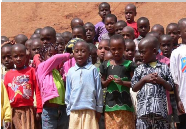
Centre Isangano : enfants de l'école enfantine

Le génocide de 1994 a plongé le Rwanda dans une crise profonde, rendant encore plus difficiles des conditions de vie déjà précaires. Nous croyons cependant à un développement qui mise sur la formation de la jeunesse. Celle-ci représente à nos yeux le plus sûr investissement du pays.