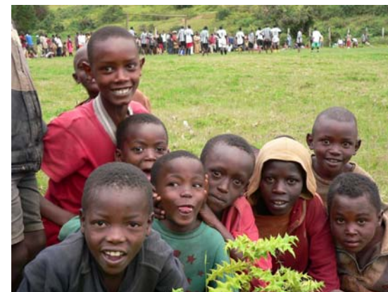
Spectateurs de la finale de foot au pied de la colline de Vumbi

A BUTARE au sud du Rwanda, une équipe de bénévoles le Groupe Nos Enfants (GNE) constituée de dix animateurs engagés dans le processus de réconciliation assure bénévolement le suivi de jeunes en âge scolaire ne disposant d'aucun moyen financier.