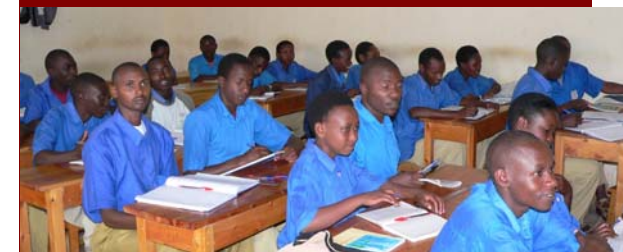
Ecole technique de Kabgayi à Gitarama

La formation, une chance pour reconstruire le Rwanda